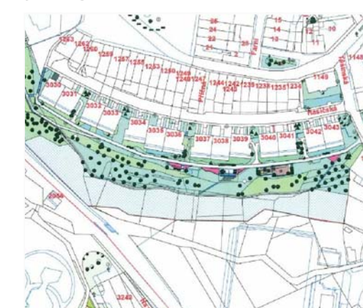
FAUNA PARK LANDSBERGERÜV PAR